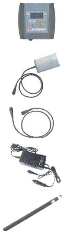
Keskuslaite (SCORP 4000)